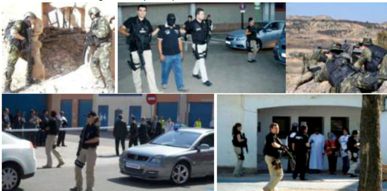
Escenas de Ejercicios varios de entrenamiento, llevados a cabo por el Grupo GEES Spain y DISTRIPOL (2011)

¿Por qué?, la respuesta es contundente, y no es otra que porque además que optimiza los entrenamientos en sí, mejorando las capacidades y destreza de aquellos que lo ejercitan, este entrenamiento se puede llevar a cabo en cualquier dependencia, permitiendo utilizar vehículos, edificios o espacios que no se deterioran al ser escenarios de entrenamiento, y con el añadido que las bolas de entrenamiento son biodegradables, por lo que no dañan el medio ambiente.